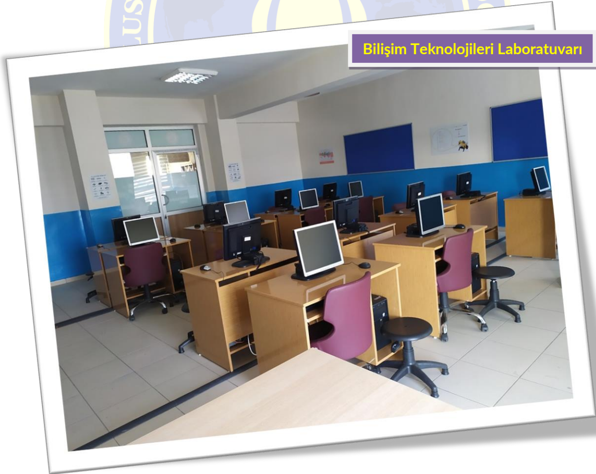
Bilişim Teknolojileri Laboratuvarı