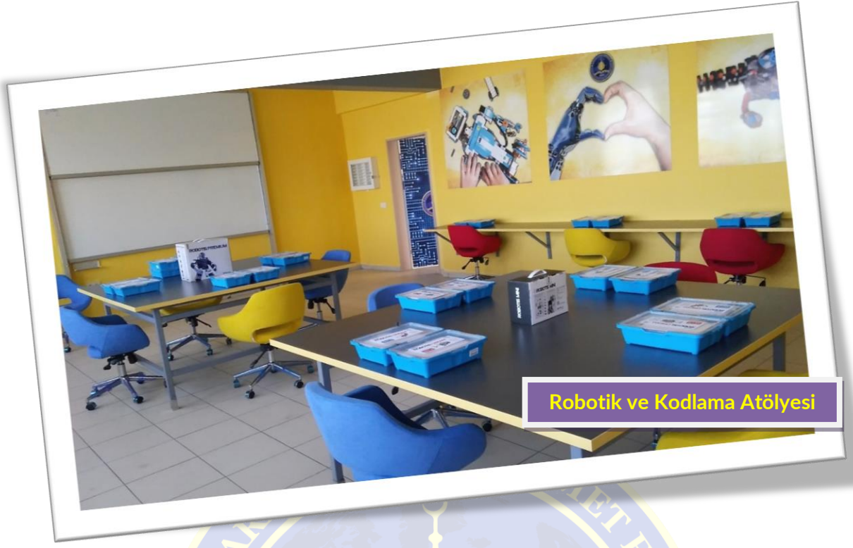
Robotik ve Kodlama Atölyesi